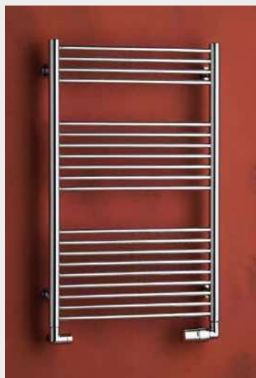
TAIFUN – provedení chrom 500 × 790 mm