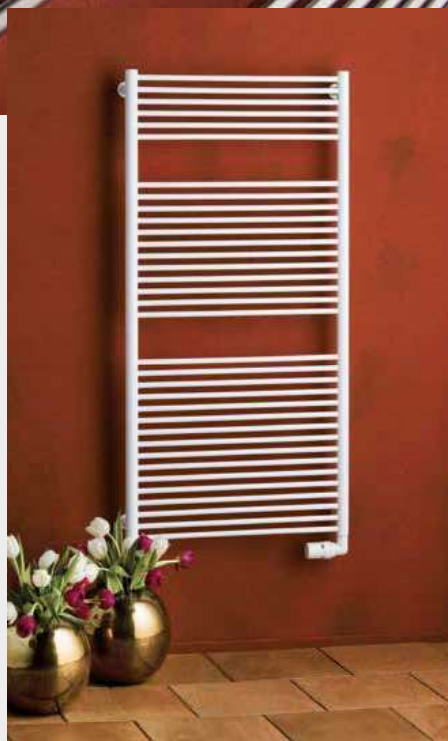
TAIFUN – provedení bílá-lak 600 × 1210 mm