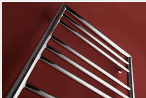
SORANO – provedení chrom 500 × 1210 mm

Umístění „uchycení“ na stěnu: ↓ 80 mm ↑ 80 mm Centrální vytápění: ANO Kombinované vytápění: ANO Elektrické vytápění: ANO Horizontální trubky: Ø 20 mm Vertikální trubky: Ø 32 mm