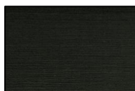
R.MANDILLO V 2