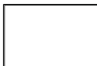
R.MANDILLO V 1